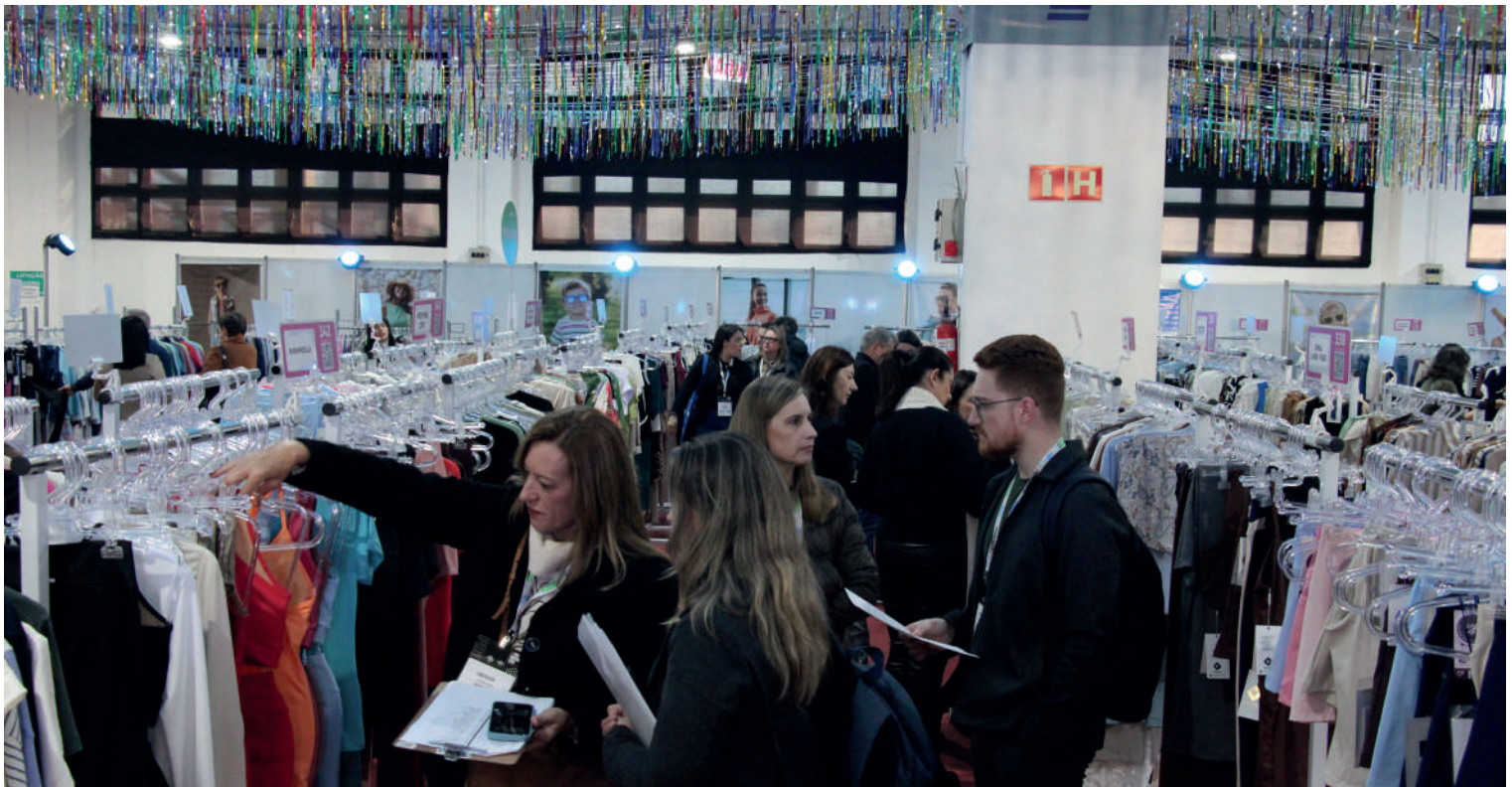
A Rodada apresentou a coleção Primavera Verão/26 de cerca de 140 fabricantes catarinenses