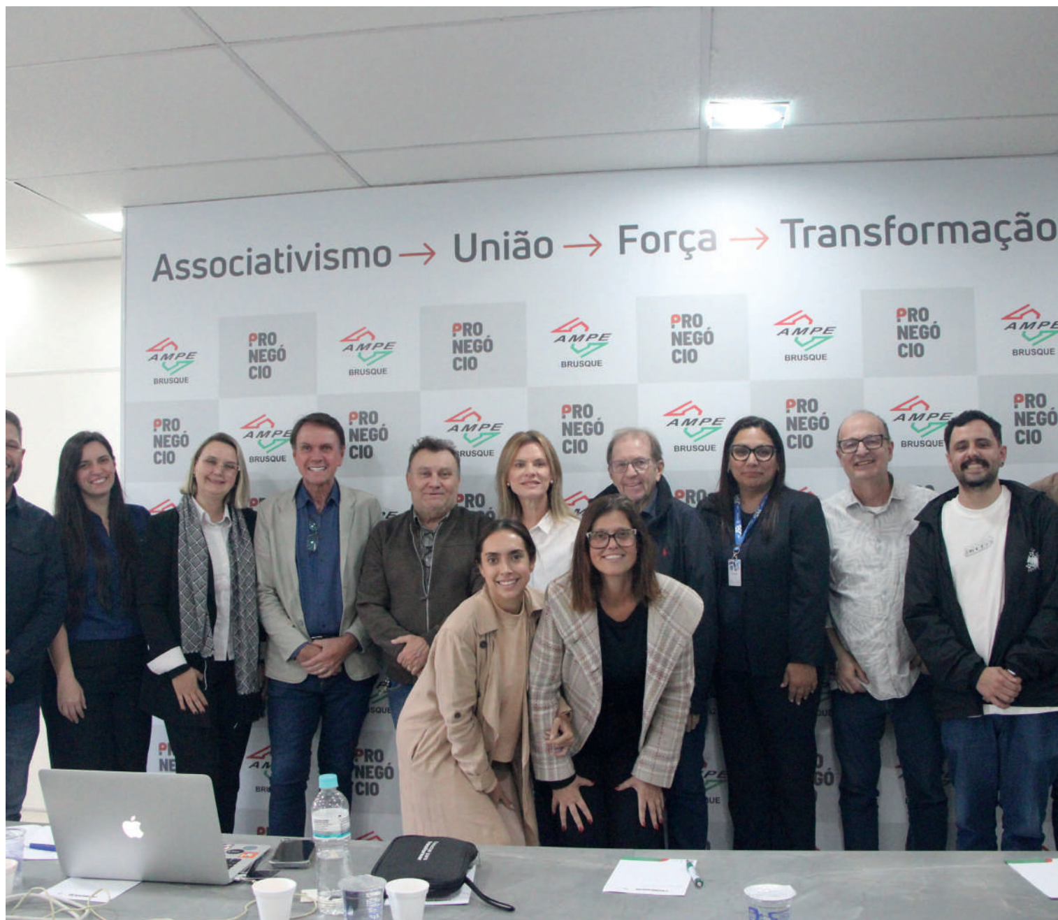
Reunião, realizada na sede da AmpeBr, teve como foco o avanço na construção da marca território de Brusque e discutir os preparativos do evento de ativação da marca