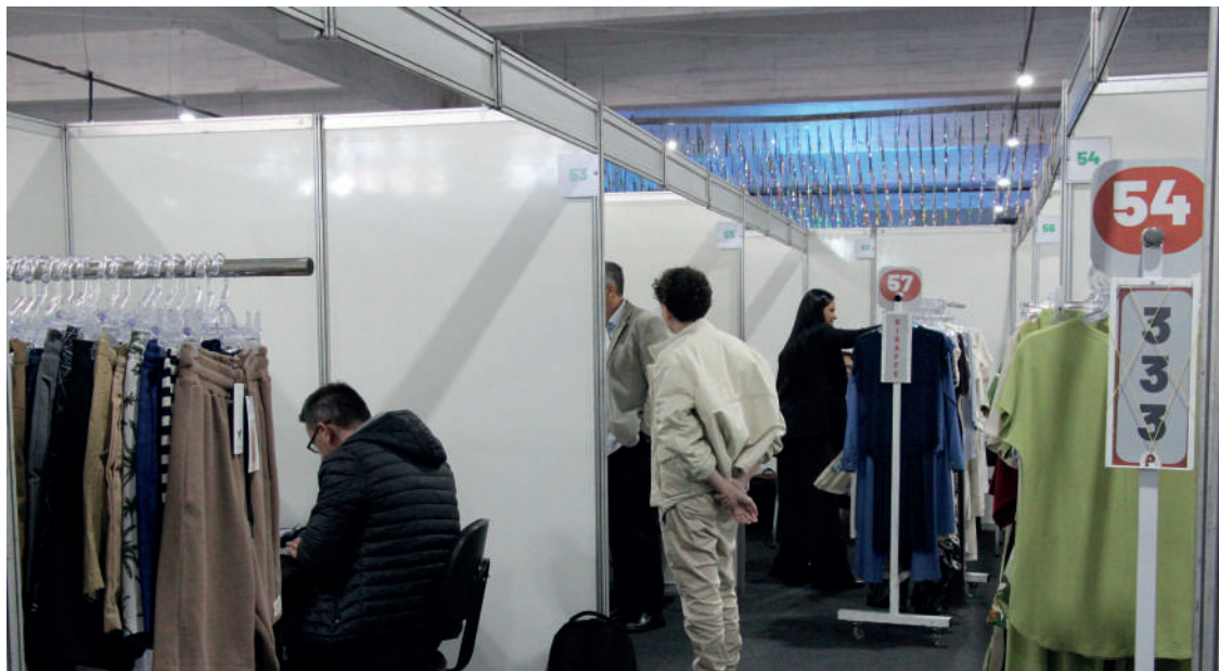
O evento, considerado a maior rodada de confecção do país, reuniu mais de 650 compradores, no Pavilhão da Fenarreco

“Neste momento fazemos uma entrada menor de coleção porque nosso maior volume acontece em agosto, mais próximo do verão. Mas sempre encontramos novos parceiros, produ-